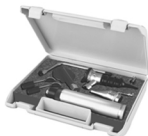
01.0250.00 Complete ENT set