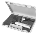
01.0240.00 Ophthalmoscope and Otoscope set