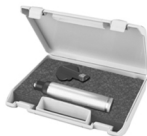
01.0230.00 Ophthalmoscope set